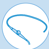
Transösophageale Ultraschallsonden (TEE)