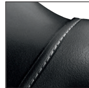
GÜK mit versenkten Nähten