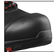
HAIX® Composite Schutzkappe