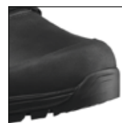
Protezione della punta