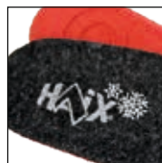
Sottopiede invernale certificato